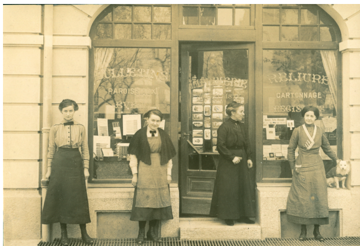
Les premières éditions du « Nouvelliste valaisan » sont sorties des presses agaunoises en 1903.

Aujourd'hui, avec la baisse des vocations, la communauté de la maison mère ne compte plus qu'une douzaine de sœurs à Saint-Maurice. Elle peut toutefois compter, depuis 1960, sur le dynamisme de jeunes togolaises, qui poursuivent sa mission en France et en Afrique.