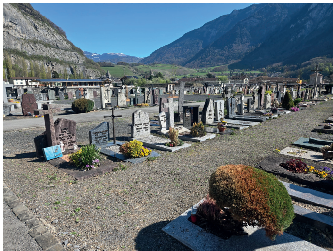
Le réaménagement paysager vient de commencer.

Cette transformation ne se fait pas du jour au lendemain : la végétation doit s'installer, prendre racine et trouver son équilibre. Cela demande un peu de temps, et donc un peu de patience de la part de tous, équipes comme visiteurs. La nature ne fonctionne pas en mode accéléré, et c'est très bien ainsi. Même si le chantier bouscule temporairement les habitudes, cette phase est essentielle. C'est en laissant le temps faire son travail que le lieu