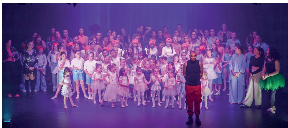
L'école de danse, qui fête ses vingt ans, comptabilise aujourd'hui 140 élèves. Un record. Leo Dance

Pour son anniversaire, l'école de danse agaunoise propose un spectacle unique, sous un chapiteau.