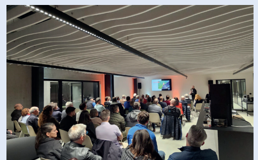
La soirée a permis d'encourager le développement économique de la commune.

Exercice réussi de prise de contact et de réseautage. A renouveler !