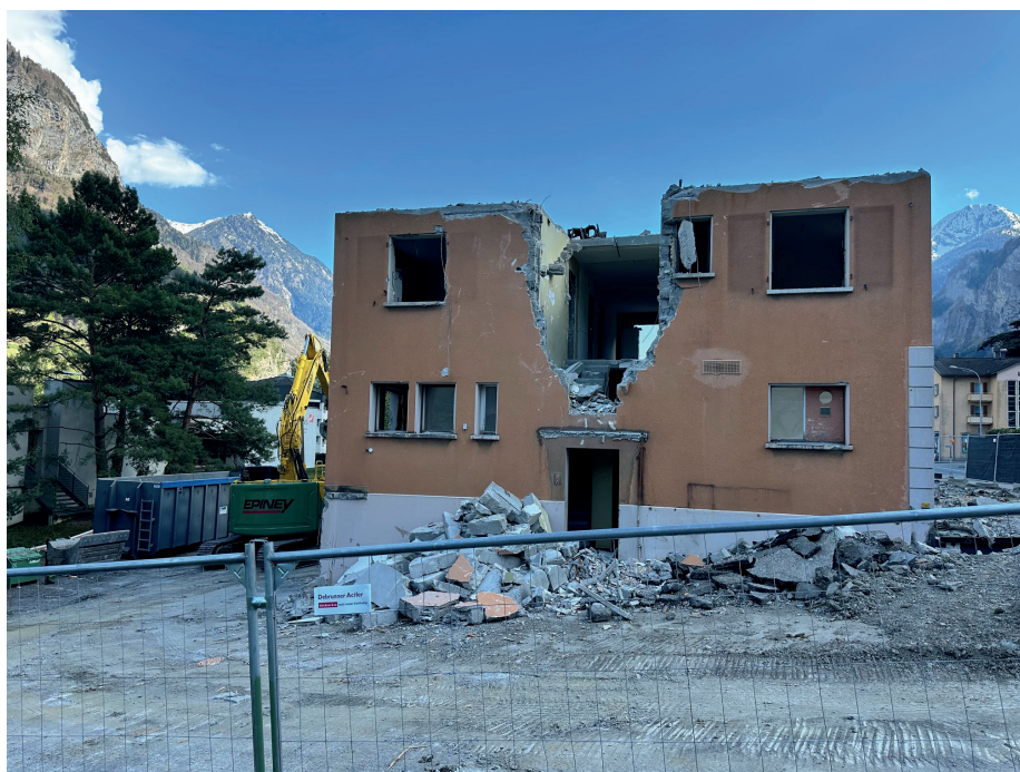
Les travaux ont déjà commencé sur l'Avenue du Simplon.

Les études de faisabilité suivent leur cours et la mise à l'enquête de l'épine dorsale du réseau (liaison Monthey-Saint-Maurice par Massongex et Bex) est annoncée pour ce premier semestre 2026. Sur la base du dernier planning transmis, l'épine dorsale devrait être livrée pour la fin de l'année 2029. Une