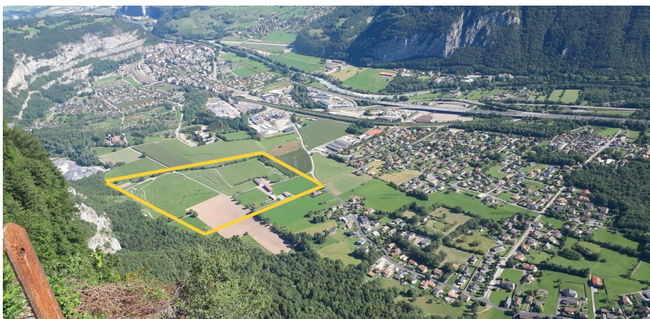
Le site concerné (en jaune) se situe à Vérolliez.

La cohabitation entre la place de tir de Vérolliez et l'urbanisation de Saint-Maurice est devenue impossible.